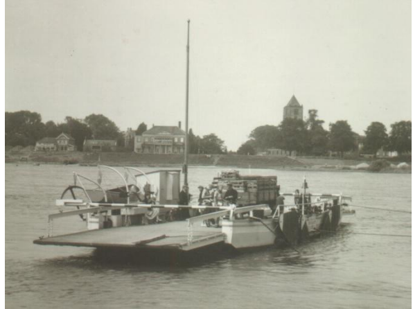
Hier vertrekt de pont net naar Tiel vanuit Wamel, dat is af te leiden uit de stand van de pont t.o.v. de stroom die hier van rechts komt...