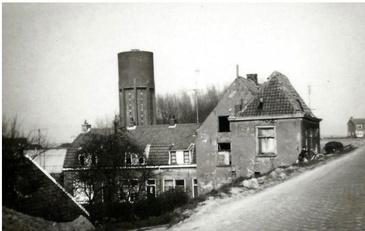
Veerhuis Zandwijk

Aan de overkant kwam men uit in Zandwijk, op de plek waar het Nachtegaallaantje op de Echteldsedijk uit komt. (zie de bovenste pijl)