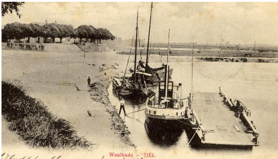
De gierpont gekoppeld aan een sleper, om er zo vrij mee te kunnen varen. Foto genomen in 1904